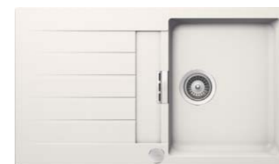
Cristadur Spüle – Schock Signus D 100