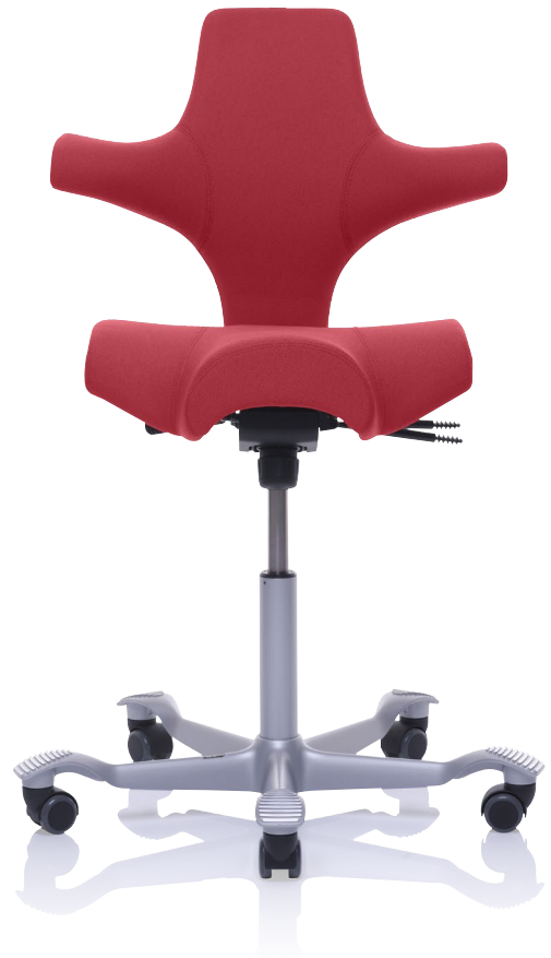
Design: Peter Opsvik. Patent- und Designgeschützt.