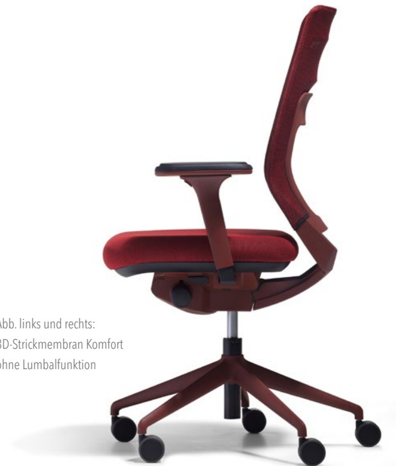
Abb. links und rechts: 3D-Strickmembran Komfort ohne Lumbalfunktion

Der fm asiento ist nicht irgendein Bürostuhl. Der fm asiento ist ein Unikat – einzigartig und unverwechselbar. Ein Stuhl mit einem fm-eigenen Look, einem modernen Farbkonzept und einem einzigartigen Materialmix. Der fm asiento ist komplett über fm entwickelt und wird mit eigenen Werkzeugen in Deutschland produziert.