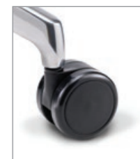
für weiche Böden